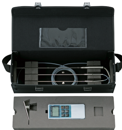
▲収納ケース(収納例)